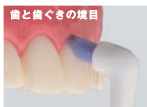
歯と歯ぐきの境目

歯と歯の間や奥歯の後ろ側、矯正装置の周辺など、特にみがきにくい部分に軽く当てて集中的にみがきます。