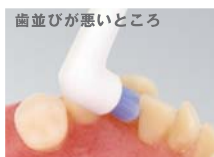
歯並びが悪いところ